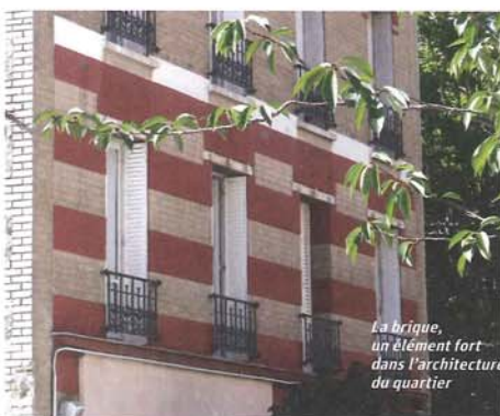
La brique, un élément fort dans l'architecture du quartier

Grâce à une concertation entre notre équipe et celle du Conseil général, les vœux des enseignants ont pu être intégrés dans le cadre fixé par les contraintes techniques. Notre école mélange maternelle, primaire et collège; le futur bâtiment va nous offrir à la fois des locaux propres à chaque classe, et d'autres partagés, pour que nous puissions organiser facilement des activités communes aux petits et grands. C'était un élément important pour nous. Nous allons aussi avoir plus de surface, mais sans pour autant diminuer la cour. De même, sont très attendues la salle polyvalente et la nouvelle salle de restauration qui va complètement transformer la pause du midi pour les élèves.