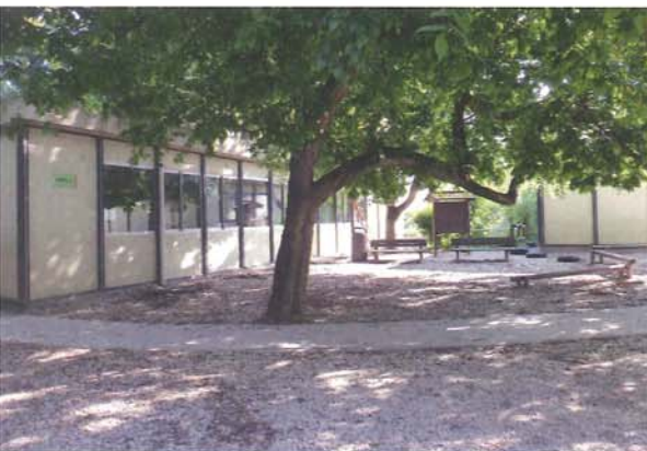
Une partie de l'école fonctionne aujourd'hui dans des bâtiments préfabriqués.

Pour faire face à ces différents enjeux, un travail de concertation a été mené entre la communauté scolaire, la Direction Académique, la Ville de Saint-Mandé, les Architectes des Bâtiments de France et le Conseil général du Val-de-Marne. Résultat : une décision ferme de rénover l'école et l'émergence d'un projet adapté aux besoins et aux contraintes.