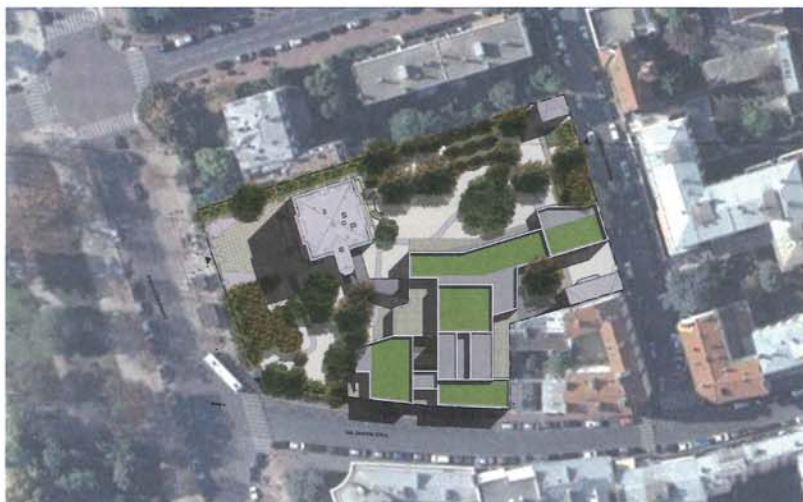
Les toits du nouveau bâtiment seront végétalisés.