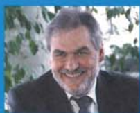
CHRISTIAN FAVIER SÉNATEUR PRÉSIDENT DU CONSEIL GÉNÉRAL DU VAL-DE-MARNE

La rénovation de l'école Decroly correspond à une forte reconnaissance par le Département de la pédagogie Ovide Decroly. Ce groupe scolaire accueille 365 élèves en maternelle, en école élémentaire et au collège.