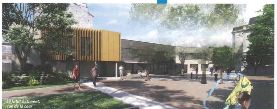
Le futur bâtiment, vue de la cour