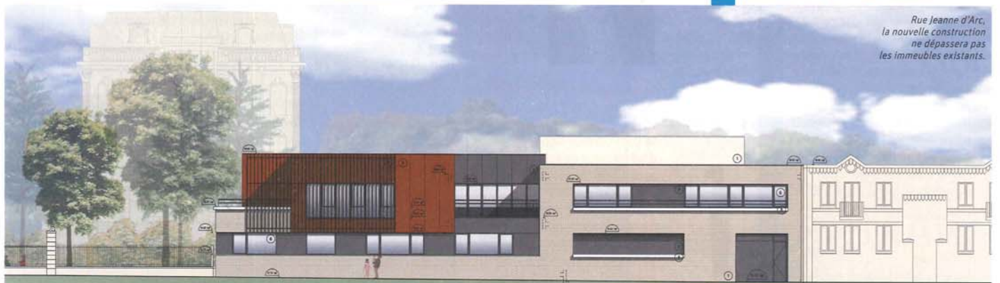
Rue Jeanne d'Arc, la nouvelle construction ne dépassera pas les immeubles existants.